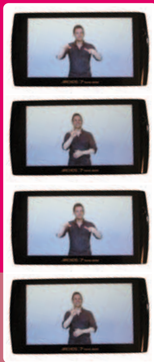
Visioguides en LSF. traducteur Ludovic Ducasse

Le musée est fier de pouvoir proposer ce projet pilote et expérimental. Il remercie vivement la SAAM et Cinésourds de leur travail, implication et réalisation !