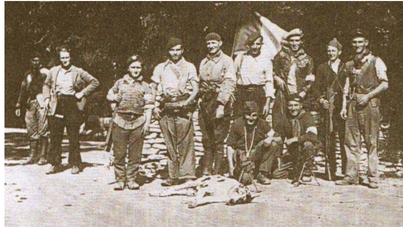
Auberive : quelques résistants du maquis en septembre 1944.

Des résistants qui ont échappé aux arrestations demandent alors à un officier à la retraite, le colonel de Grouchy, d'organiser la Résistance du département.