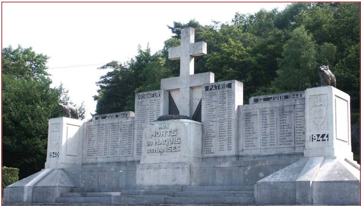
Le monument des Manises à Revin dans les Ardennes

Le manque d'unité résultant de son étirement dans l'espace est amplifié par le cloisonnement en zones issu de la défaite de 1940, les velléités de la politique régionaliste de Vichy, et les contraintes du découpage en régions de la Résistance :