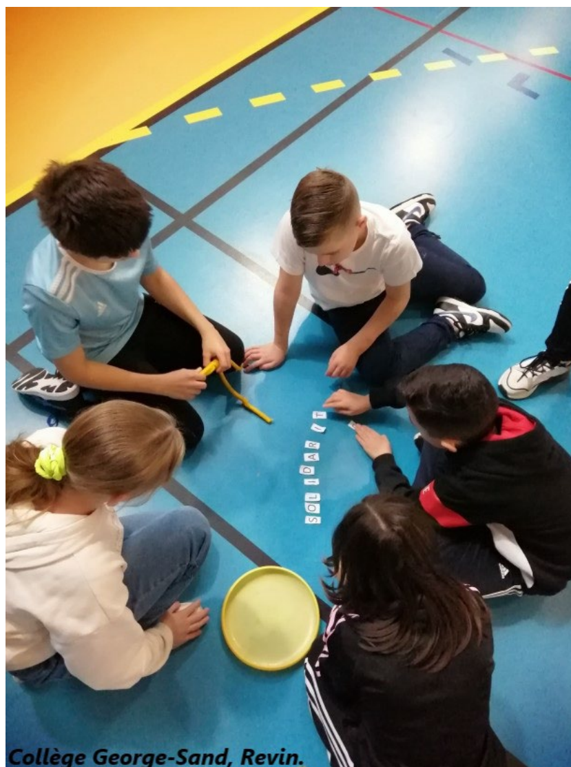
Collège George-Sand, Revin.

Les élèves de 6 e ont accueilli les élèves de CM2 du réseau d'éducation prioritaire de Revin pour travailler ensemble autour des valeurs de la République et du principe de laïcité, encadrés par les enseignants et les assistants pédagogiques. Répartis en plusieurs ateliers ludiques, ils ont pu ainsi réfléchir, collaborer et produire des œuvres collectives. Tous se sont retrouvés à la fin de la rencontre pour entonner la Marseillaise.